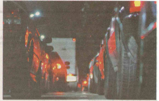
Interrupção da travessia causou fila de carros e espera de 40 minutos

formou que não foram registrados problemas nos morros e o único incidente foi a queda de uma árvore na Rua Liberdade, no Embaré. Segundo o instituto de meteorologia Climatempo, a chegada hoje ao Estado de uma frente fria vinda do Sul – com chuvas ao longo do dia e queda na temperatura – pode acarretar novas ventanias.