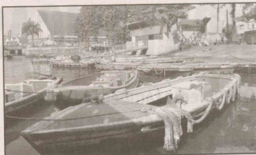
Terminal das catraias no Mercado: reforma em parceria

dos os sanitários, equipamentos indispensáveis à estrutura do local e que sofrem constantes depredações, apesar de toda a manutenção da Associação dos Catraieiros.