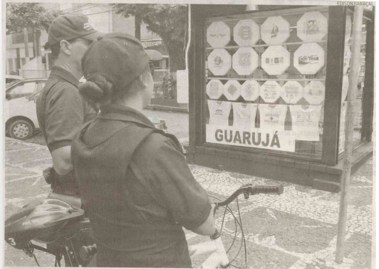
Os guardas chamam a atenção para os recentes episódios de violência sofridos durante o trabalho